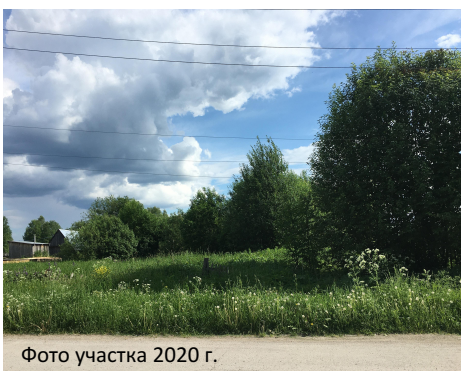
Фото участка 2020 г.